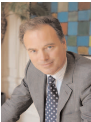
Renaud Dutreil Ministre des PME, du Commerce, de l'Artisanat et des Professions libérales