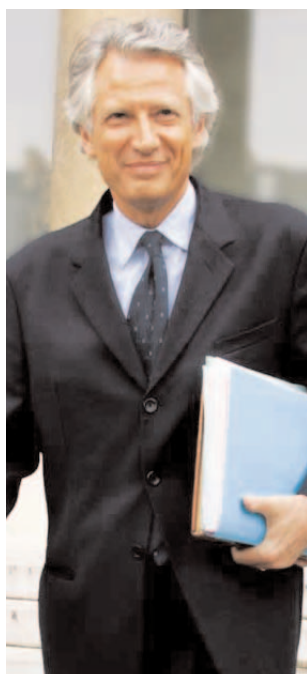
Dominique de Villepin Premier ministre

Le contrat nouvelles embauches, en particulier, prévoit à la fois des mesures de reclassement personnalisé, des indemnités en cas de rupture et un préavis qui croît avec le temps passé dans l'entreprise. Les efforts de chacun sont ainsi reconnus et valorisés et les droits des salariés protégés. Comme je m'y étais engagé, le plan d'urgence pour l'emploi est opérationnel. À nous de le mettre en œuvre ensemble pour que l'activité économique soit mise au service de l'activité de chacun !